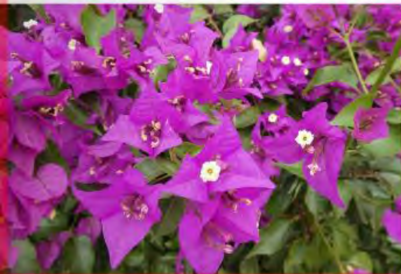
Bougainville i La Aldea San Nicolas / Kottar på Araucaria heterophylla - Maspalomas