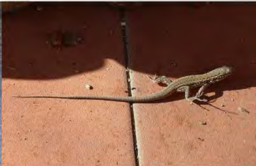
Ökenigelkott från Sahara / Gallotia stehlini ödla