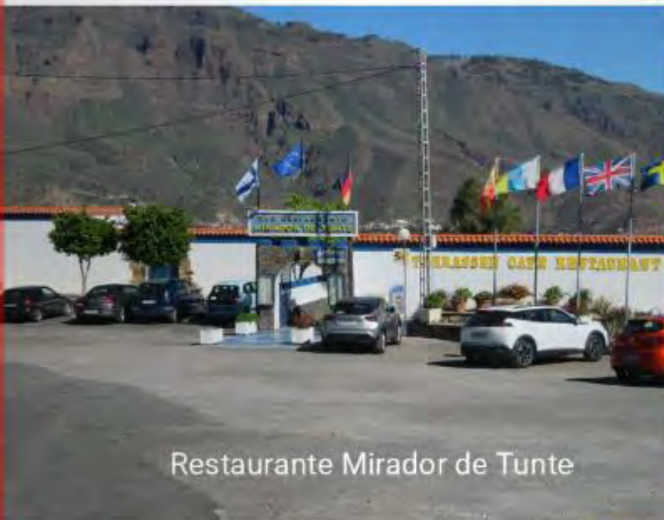
Restaurante Mirador de Tunte