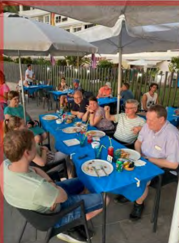
Restaurante Sol e Sombre