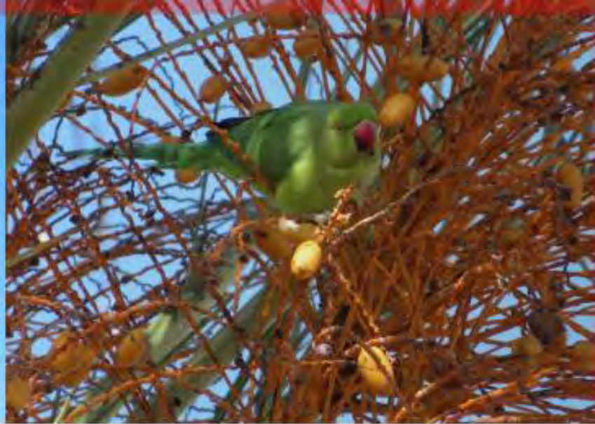
Turkduva, Eurasian collared dove / Rose-ringed parakeet