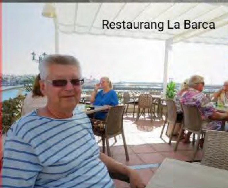
Restaurang La Barca