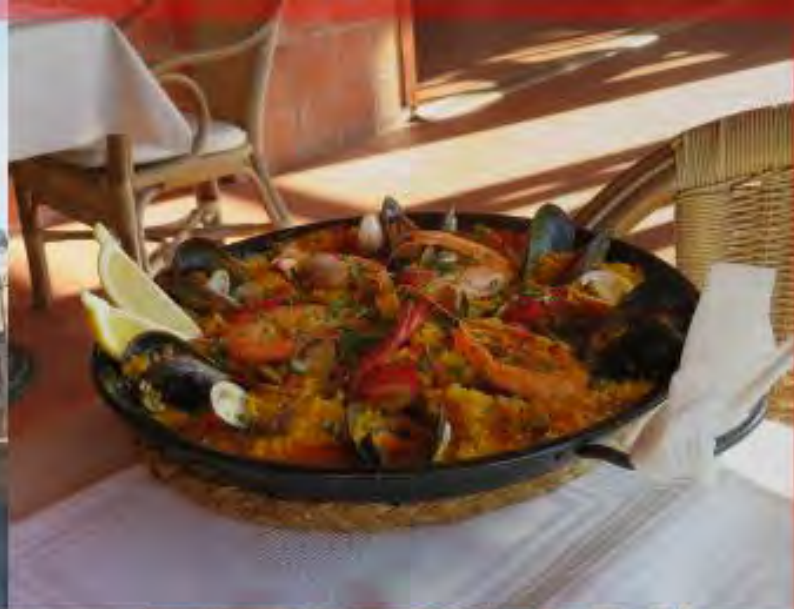
Paella de Mariscos på Restaurante Los Pescaitos